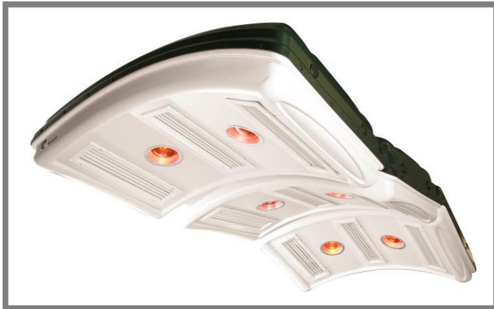
MaXuSS Zephyr - Pferdeföhn