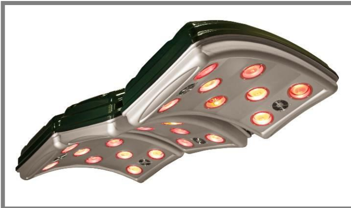
2 x das MaXuSS Basismodell