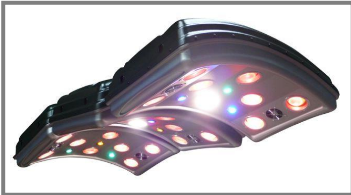
MaXuSS Thera 230 / MaXuSS Thera 400